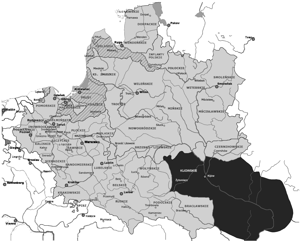
Ilustracja 1: Rzeczpospolita w okresie największego zasięgu terytorialnego. Na czarno zaznaczono obszar, którego dotyczy niniejszy tom

Kijów leży w miejscu szczególnym dla Europejczyka – to linia, gdzie kończą się lasy i bagna Polesia, podobne do lasów i bagien Wielkopolski, Żmudzi czy Szwecji, a zaczyna się bezkresny eurazjatycki step, ciągnący się od Mołdawii po Mandżurię, od delty Dunaju aż po Morze Żółte. Podążający z północnego zachodu skandynawscy Rusowie (Normanie pod wodzą Ruryka), bałtyjscy Litwini czy zachodniosłowiańscy Polacy stawali więc w Kijowie niczym w porcie, skąd mogli – jak choćby Mickiewicz – „wypływać na suchego przestwór oceanu”. Mówiąc o granicach Kijowszczyzny warto więc osobno omawiać granice „lądowe” (północno-zachodnie) od granic południowo-wschodnich, które była umowne niczym granice wód terytorialnych narysowane na mapie pośrodku morza.