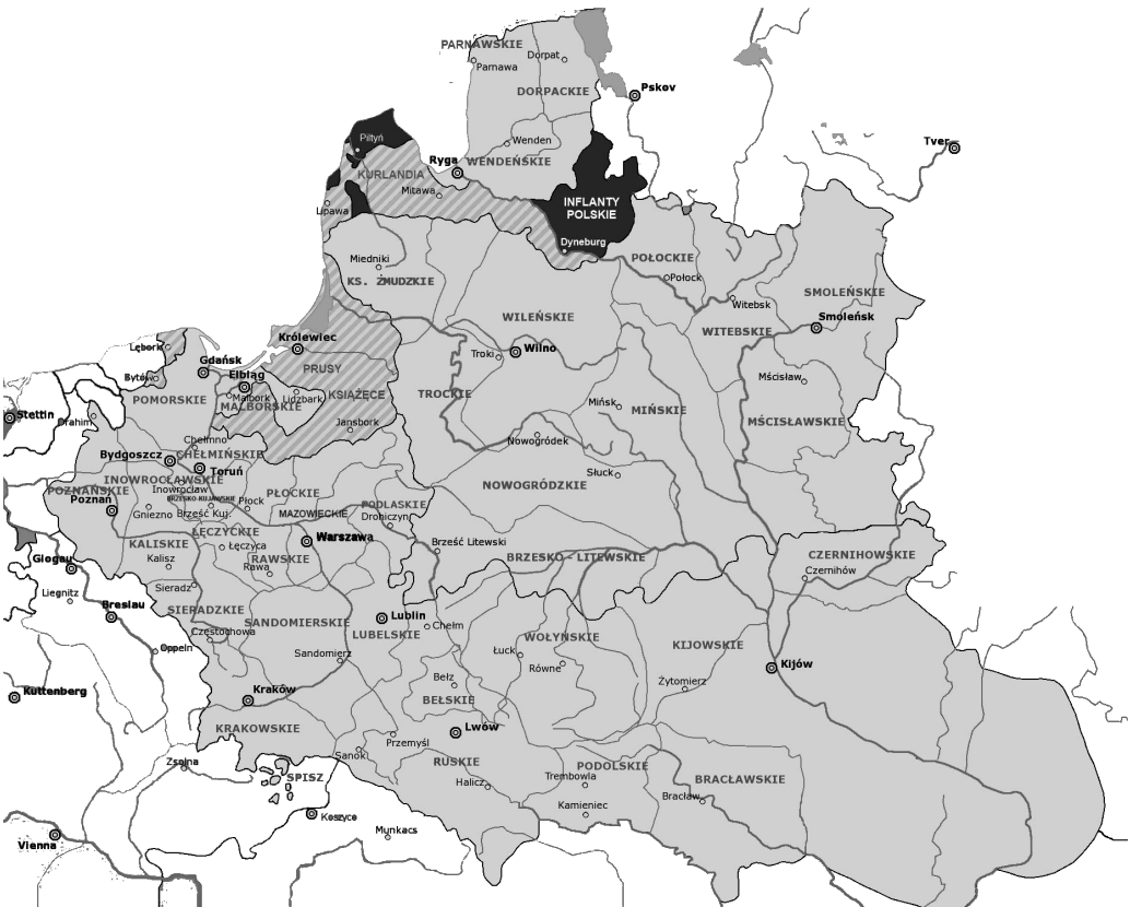
Ilustracja 1: Rzeczpospolita w okresie największego zasięgu terytorialnego, źródło: Wikipedia, Wolna Encyklopedia. Na czarno zaznaczono obszar, którego dotyczy niniejszy tom

Ziemie dawnej Rzeczypospolitej w granicach dzisiejszej Estonii to dawne województwa parnawskie ze stolicą w Parnawie (dziś Pärnu) i derpskie (dorpacckie) ze stolicą w Dorpacie (dziś Tartu). Polska straciła je na rzecz Szwecji i rzekła się w Pokoju w Oliwie w roku 1660, a wojewodowie parnawski i derpski nie zasiadali już więcej w Senacie Rzeczypospolitej. Trzeba jednak przyznać, że Dorpat pozostał Polakom bliski: na tamtejszym uniwersytecie studiowało wielu Polaków i tamże założono w 1828 r. pierwszą polską korporację akademicką, Konwent Polonia.