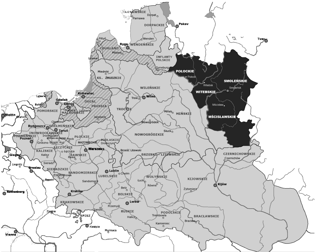
Ilustracja 1: Rzeczpospolita w okresie największego zasięgu terytorialnego, źródło: Wikipedia, Wolna Encyklopedia. Na czarno zaznaczono obszar, którego dotyczy niniejszy tom