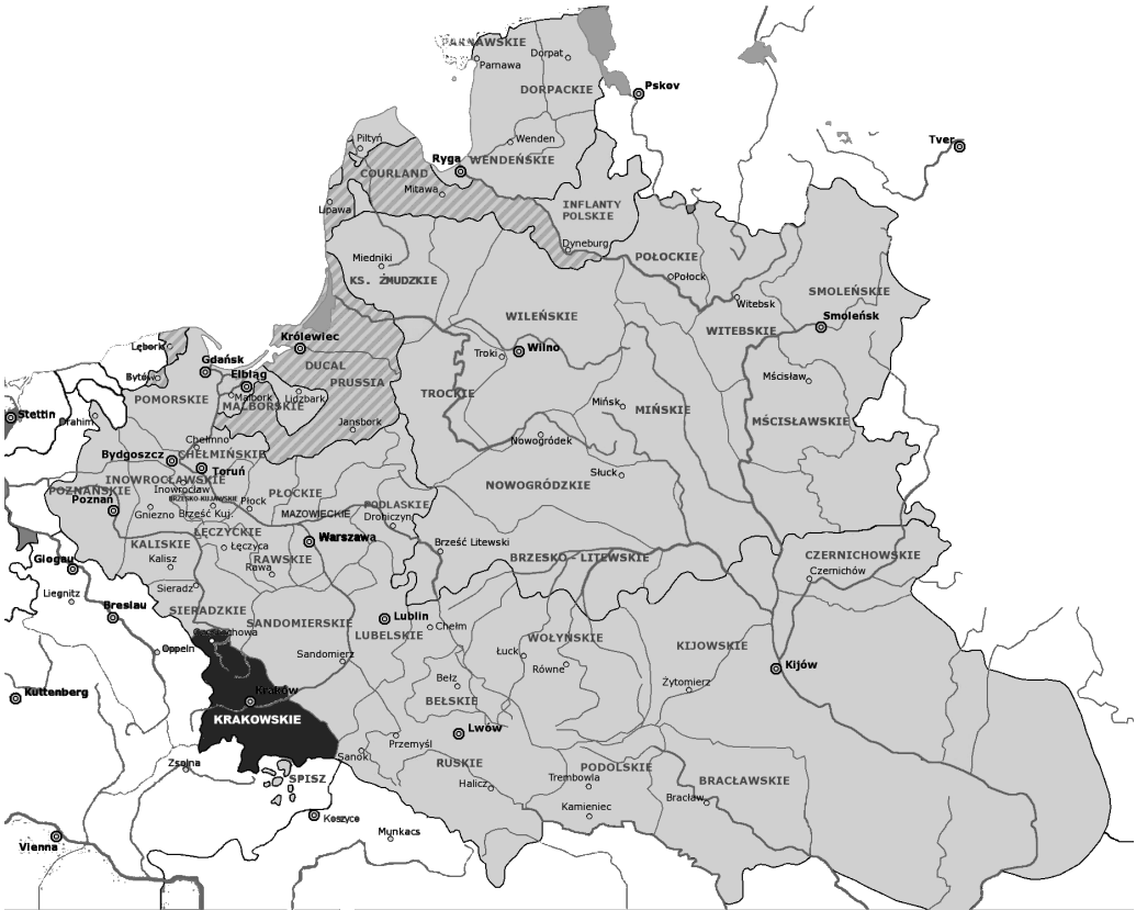
Ilustracja 1: Rzeczpospolita w okresie największego zasięgu terytorialnego. Na czarno zaznaczono obszar, którego dotyczy niniejszy tom

Wszystkie przedstawione tu osoby stanowią jedną rodzinę, którą udało się pomieścić na jednej tablicy wraz z posłami krakowskimi, którzy znajdują się w osobnym tomie ( Elita krakowska poselska ). Tablica ta umieszczona jest na końcu niniejszego tomu.