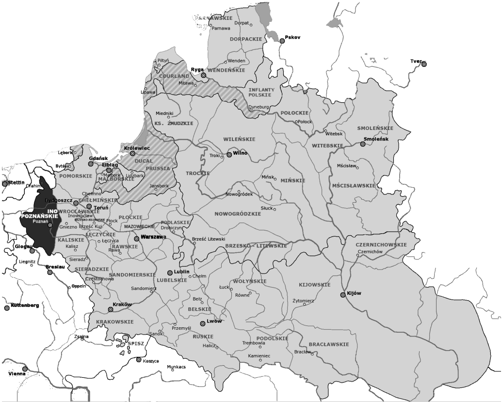
Ilustracja 1: Rzeczpospolita w okresie największego zasięgu terytorialnego. Na czarno zaznaczono obszar, którego dotyczy niniejszy tom

Te czynniki spowodowały, że genealogię elity poznańskiej znamy tak dobrze, że rozbić ją musimy na dwa osobne tomy. W tomie niniejszym znajdują się rodziny senatorskie i rodziny posłów ziemi wschowskiej.