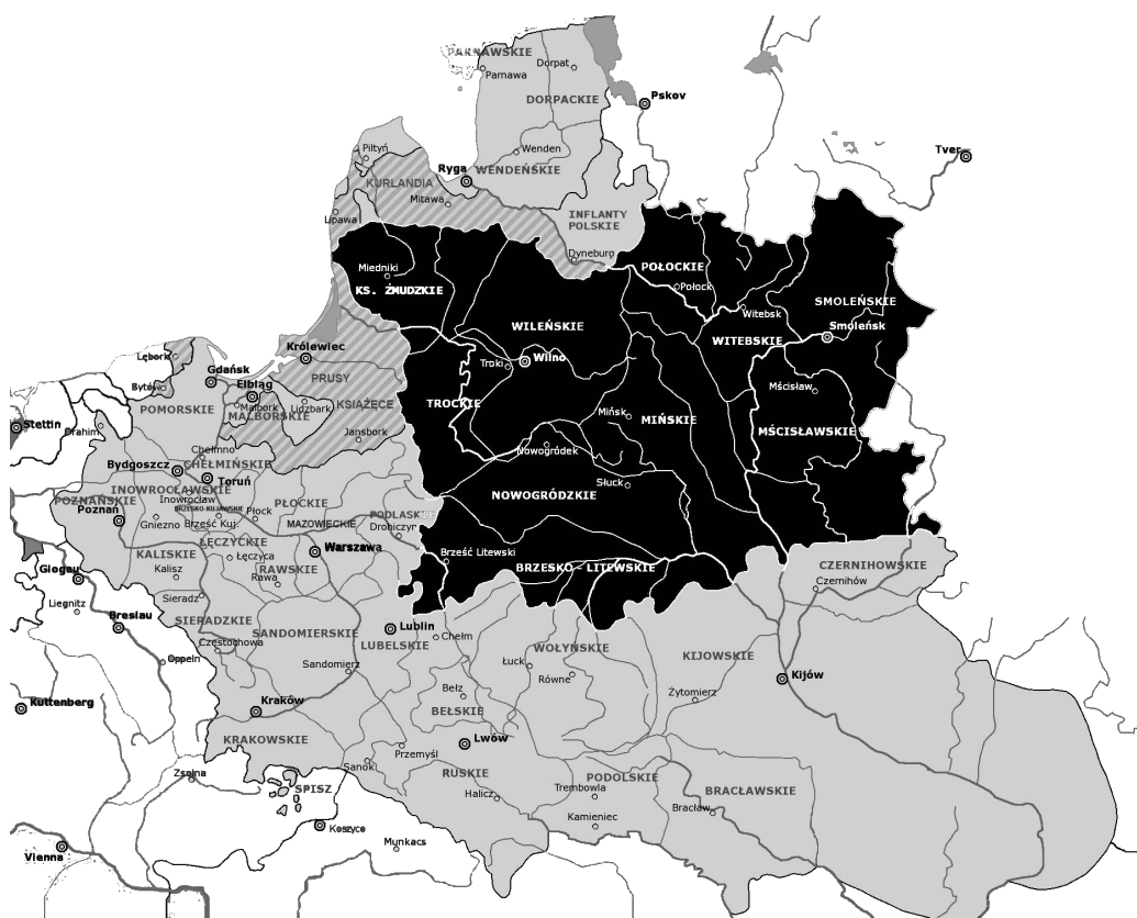
Ilustracja 1: Rzeczpospolita w okresie największego zasięgu terytorialnego, Na czarno zaznaczono obszar, którego dotyczy niniejszy tom

W 1569 r., na trzy lata przed śmiercią ostatniego Wielkiego Księcia Litewskiego z dynastii Jagiellonów, Zygmunta II Augusta, Wielkie Księstwo Litewskie zawarło unię z Koroną Polską wiążąc się z nią na trwałe w jeden organizm. Dokonano wtedy wielkiego przesunięcia granic WXL: Korona przejęła województwo podlaskie (dawne sporne tereny między Litwą a Mazowszem, wcielonym do Korony 40 lat wcześniej) oraz trzy południowe województwa: kijowskie, wołyńskie i braclawskie (oraz pretensje do Rusi Czernihowskiej, która zdobyta przez Moskwę w 1503 jako część Litwy wróciła w 1619 r. już do Korony). Odtąd południowa, zachodnia i północna granica Litwy pozostawała niezmienna, obejmując z grubsza ziemie dzisiejszych państw Litwy i Białorusi.